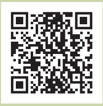
広げよう「里親」の輪 (里親制度特設サイト)

詳細については、南予子ども・女性支援センター(児童相談所)にお問い合わせください。