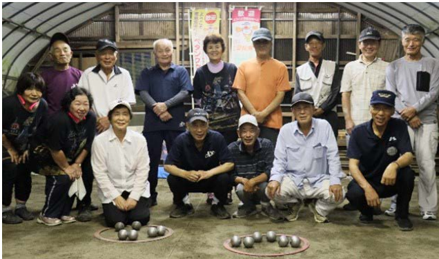
日吉ペタンク連盟

10月に行われるねんりんピックに向けて練習に励む日吉ペタンク連盟の皆さんです。今大会について伺ったところ、「まず、鬼北町で行われることに驚いた！目標は優勝、まずは予選突破」と意気込みます。会員には約