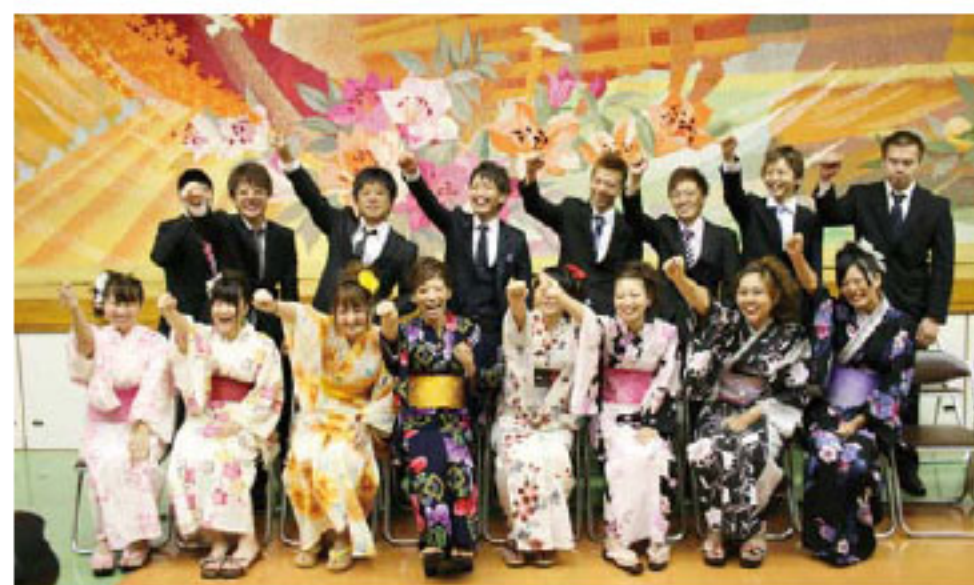
成人を祝して記念撮影

お世話になった先生方からのお祝いビデオレターなども上映され、新成人たちからは「懐かしい」の声が。式典後には、恩師や旧友と会食をしながら、久しぶりの再会と新たな門出の喜びを分かち合いました。