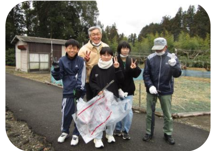
高鴨神社から国道沿いと旧道沿いの2班に分かれ、興芳橋で合流します。