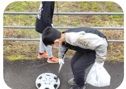
たばこの吸い殻や小さなゴミも見逃しません！ 空き缶だけではなく、ホイールカバーまで・・・