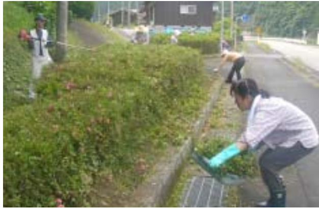
早朝から汗を流しながら、除草作業やサツキの剪定に精を出す清浄の皆さん

鬼北町ホームページ アドレス http://www.town.kihoku.ehime.jp/