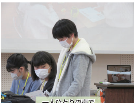
一人ひとりの声で