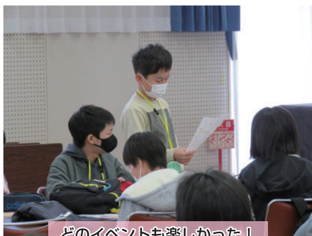
どのイベントも楽しかった！