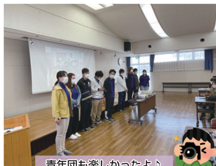
青年団も楽しかったよ♪