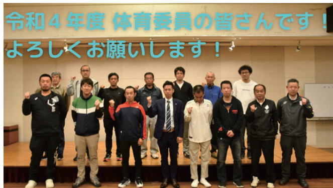
令和4年度 体育委員の皆さんです！ よろしくお願いいたします！