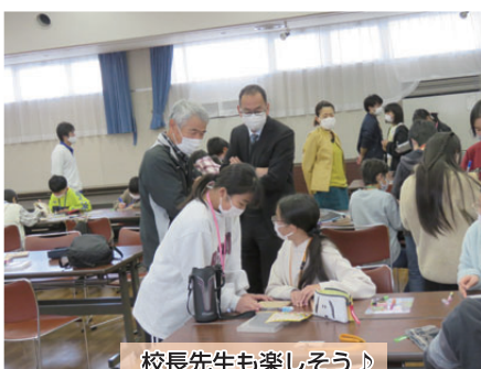
校長先生も楽しそう♪