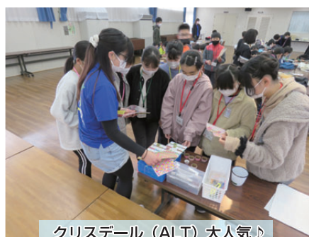
クリステール(ALT)大人気♪