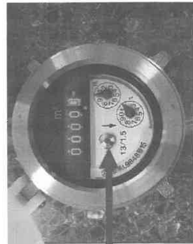
パイロットマーク

なお、漏水による使用水量の増加分にも水道料金がかかりますのでご注意ください。(不可抗力による地下漏水等の場合に限り、水道料金の減免が受けられる場合がありますので水道課までご連絡ください。)