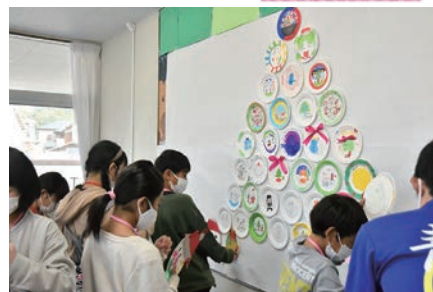
紙皿を使ったリース