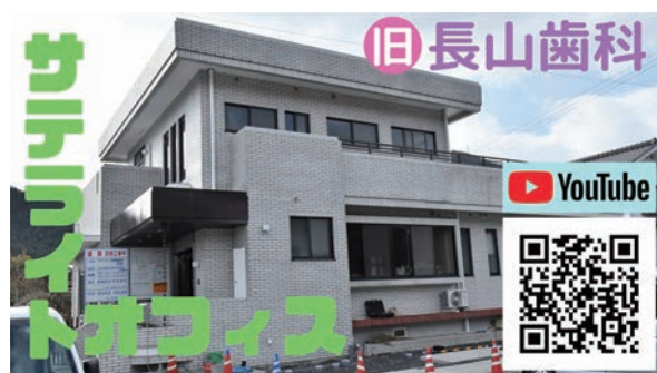
旧長山歯科 ※奈良 4048-2

上記以外にも、それぞれの施設を設置することで「地方に新たな人の流れを呼び込む」可能性が秘められています。また、活用する企業が増えれば、雇用の拡充、新たな事業の創造、関係人口の増加などに繋がることも予想されます。