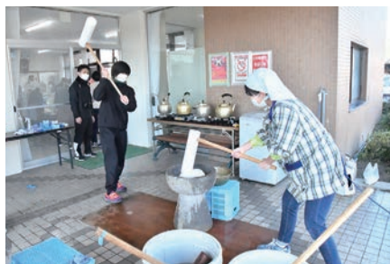
青年団女性陣も挑戦！