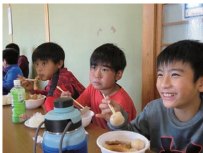
婦人会お手製のいもたき♪