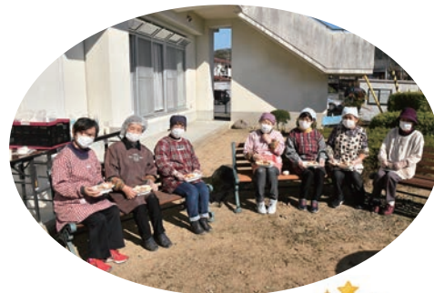
婦人会の皆さん、 ありがとうございました