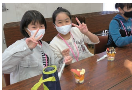
美味しそうなパフェ☆