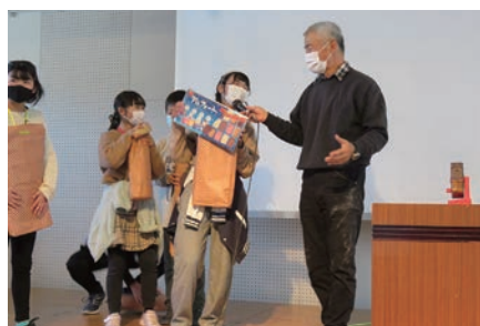
豪華景品おめでとう！