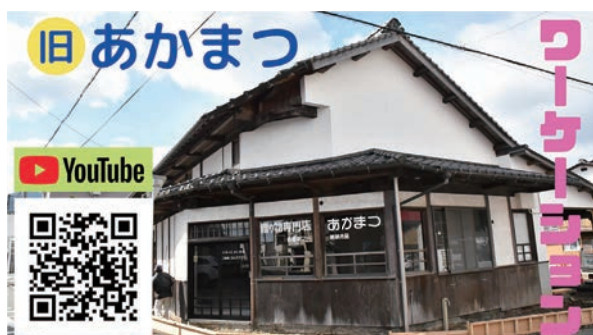
旧あかまつ ※近永 656-1