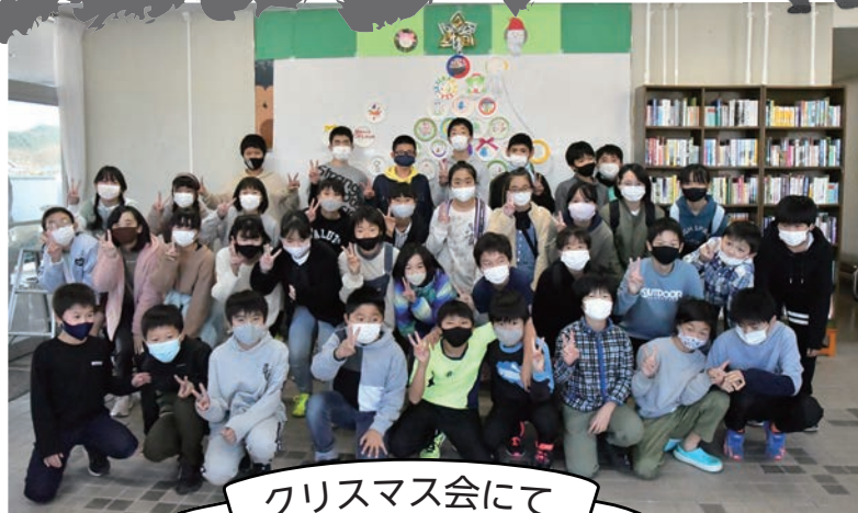
クリスマス会にて

11月「スポーツ鬼ごっこ&いもたき」、 12月「クリスマス会&もちつき」を行いました。