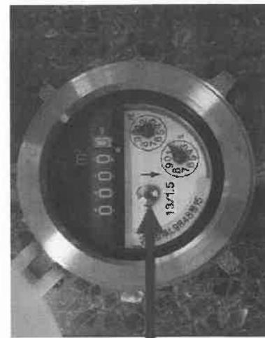
パイロットマーク

なお、漏水による使用水量の増加分にも水道料金がかかりますのでご注意ください。(不可抗力による地下漏水等の場合に限り、水道料金の減免が受けられる場合がありますので水道課までご連絡ください。)