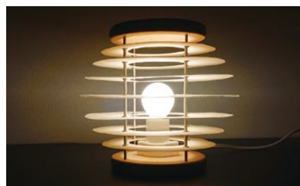
▲泉貨紙を使用した照明

立体造形が可能な泉貨紙は、幅広い分野で活躍できる素材であると思っています。いつか堂々と自信を持って提案できる品物が作れるよう模索を続けていきたいと思っています。