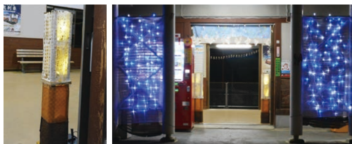
泉貨紙を使った燈籠(左)、駅入り口を彩るイルミネーション(右)

燈籠には、糸が入ったレースの泉貨紙や柿渋で染めた泉貨紙などを使用。燈籠やイルミネーションの優しい灯りが近永駅を照らしていました。