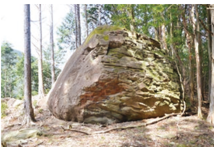
▲正連寺駐場という地点にある「タモト岩」