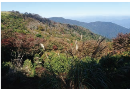
▲三本杭越しに古鬼ヶ城を望む

四 松野町の滑床溪谷にある「鼓岩」と呼ばれる大岩を「鬼王 段三郎」やその主君、曾我兄弟が力試しで動かしたとの伝承がある。