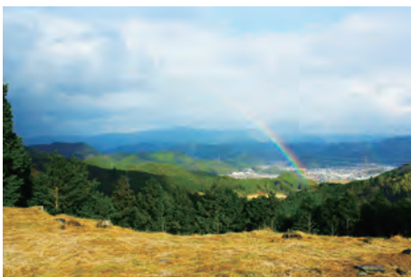
▲等妙寺旧境内智光院跡からの景色

昨今、人々の記憶から衰滅しつつある地域の歴史や文化に目を向けることは、地域の魅力の再発見に繋がります。それを現代社会にいかにか活かすか思考することが重要で、今後のまちづくりの出発点になります。地域の財産・宝であり、鬼北の「おに」と密接に関わる等妙寺旧境内が地域住民で考え、護り、未来へと継承できるとする愛される史跡になることを切に願ひ、今後も史跡の保護・活用事業に邁進していきます。