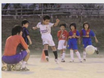
◀監督の指導の下、シュート練習に励む団員。その眼差しは真剣そのもの

「愛媛の小さな虎」が全国の大舞台で雄たけびを上げる日もそう遠くないかもしれません。