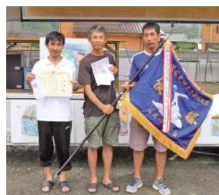
寿吉らんらんクラブ

①寿吉らんらんクラブ 46分21秒 ②かあんまあくん 47分13秒 ③アメンボ軍団 54分27秒