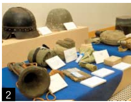
1 2 鬼北町歴史民俗資料館に展示された戦争に関する写真や当時使われていた道具の数々 3 「ひよし星降るキャンドルナイトオープニング」で行われた「光と風Hi-Fu」のライブ 4 「明星ヶ丘いきいき会」が提供した「いきいき定食」