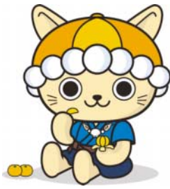
えひめ南予観光PRキャラクター「にゃんよ」

皆さんもぜひこの機会に南予9市町のご当地グルメや美味しい食材を堪能してください。