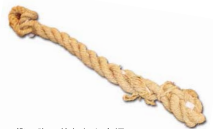
一揆の際に使われた大綱。神社、寺院の護符や、怨念を込めた女性の黒髪などを結び込んでいた。一端を大きな節に、逆の一端を輪にして、いざという時には簡単に必要な長さにつなぎ合わせる事ができるようになっていた。

に知れることを恐れた本家である宇和島藩が、吉田に出向き協議したところ「農民の要求をのみ、早期解決を図ることが上策」と決定。吉田藩に差し出した訴状23ヶ条全てが認められたのです。農民たちは完全勝利を収め、閉ざされていた苦難の道がようやく開かれた喜びに浸りました。