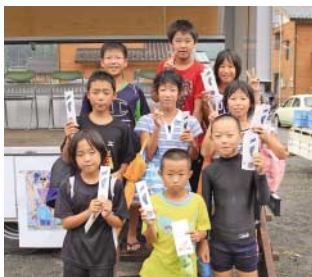
戸祇の部で上位に入賞した児童

を辞退し、大会関係者は「残念で仕方ない」と話していました。 しかし大会当日、参加チームは減ったものの、会場は参加者らの熱気にあふれていました。そして、甲岡町長のピストルの合図で一斉にスタート。滑りやすい川底、流されそうになる程の激流。参加者全員が懸命に走り抜きました。 また、今年新たに「戸祇の子の部」が新設され、三島小学校の4・5・6年生ら15人が参加し、果敢に挑んでいました。 転びながらも笑顔で走る選手、それを応援する参加者や観客など、大会は大いに盛り上がりました。