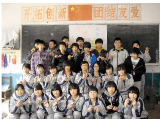
応援メッセージを書いた朝鮮族中学校生徒

日本語を勉強している生徒たちが書いたメッセージや写真、ビデオレターはJICA(独立行政法人国際協力機構)東北を経由して、いわき市に届けられる予定です。