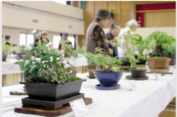
丹精込めて育てられた作品の数々

日吉小児童(4・5・6年生)とその保護者らは4月30日、日吉地区で一番高い山、地蔵山(1,128m)登山に挑みました。 参加者らはロープを握りしめながら懸命に登り、頂上付近では背丈以上あるクマザサをかき分けながら歩くなど、険しい山道を約3時間かけて登りました。 頂上では、伊予地蔵と土佐地蔵にまつわる民話を聞いたり、全員でお弁当を食べたりと、すがすがしい時間を過ごしていました。