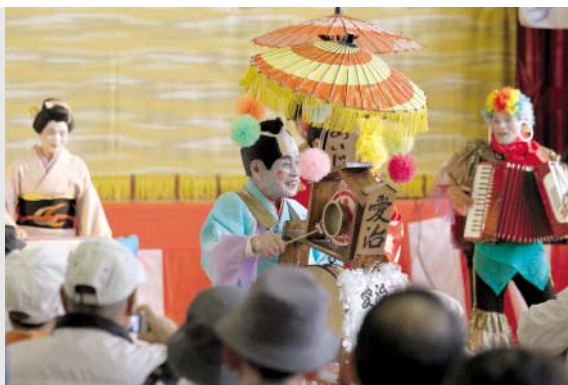
会場を演奏しながら練り歩く会員