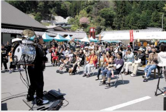
大道芸人の楽器演奏に歓喜する様子