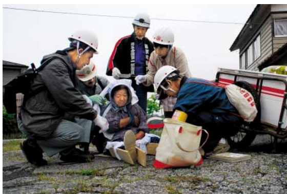
宮城県沖を震源とする大規模地震を想定した訓練