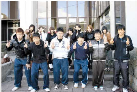
同級生のみんでピース

近所の60歳以上の方たちで構成する「北川いきがいデイサービス」の会員が2月22日、牛乳パックで作った椅子を成川溪谷休養センターに贈りました。 15人の会員によって作られた椅子はとても頑丈で、座面にはクッション材が入るといって精巧な仕上がりでした。 当センターで使用する椅子があればとの意見を聞き、作成を開始。会員は「補強のために入れた紙パイプのカットが大変だった」と話していました。