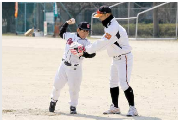
丁寧に投げ方を教わる参加者

3月に卒業となる日吉地区の高校生を対象とした「18歳春巣立ちの料理教室」は3月8日、日吉住民センターで行われ、13人が出席しました。 栄養士と生活改善推進員の指導で、一人暮らしに役立つ「かんたん栄養満点ごはん作り」を2班に分かれて調理開始。会食では、作った料理を味わいながら、新生活に対する期待や不安、情報交換などで大いに盛り上がった様子でした。