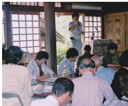
→ 職員の説明を聞く会員