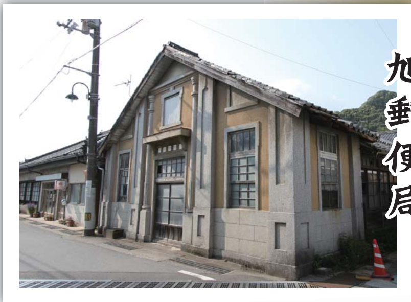
旧旭郵便局舎(現在)