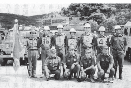
全力投球でポンプ車の部に挑戦した第1分団第8部の選手たち

消防操法の習得により団員の志気向上と消防精神の高揚を目指す愛媛県消防操法地区大会が八月三十日、吉田町の吉田球場で行われ、小型ポンプの部で広見町が優勝する輝かしい成績をおさめ、ポンプ車の部でも上位の成績をおさめました。