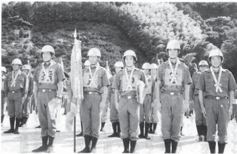
見事優勝に輝いた第5分団第4部の選手たち

消防操法の習得により団員の志気向上と消防精神の高揚を目指す愛媛県消防操法地区大会が八月三十日、吉田町の吉田球場で行われ、小型ポンプの部で広見町が優勝する輝かしい成績をおさめ、ポンプ車の部でも上位の成績をおさめました。