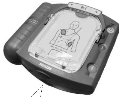
AED本体。Automated External Defibrillatorの略。日本語で自動体外式除細動器といいます。