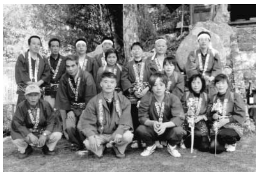
写真：山崎武雄さん

2月28日、父野川上節安薬師堂で安産や家内安全を祈願しようと、節安花とび踊りが奉納されました。 はちまき、はつぴ、わらじばきの保存会会員による踊りのあと、来場者全員に家内安全のお守りが配られました。 また、会員の方は「高齢化等による会員の減少が悩みの種だったが、今回から若い新メンバーが加わったので、うれしく思っている」と笑顔で話していました。