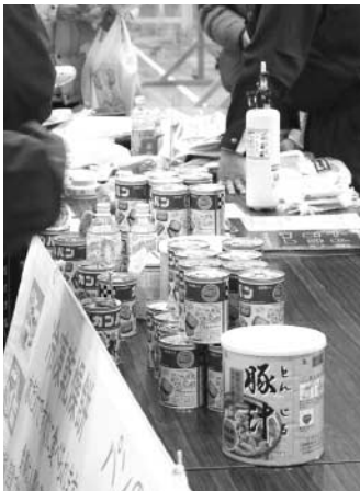
→災害時用の非常食

地震・東南海地震による大規模な災害を想定した訓練が行われました。また、鬼北町女性団体連絡協議会による炊き出しが参加者に配られたほか、非常食試食、防災グッズの展示もあり大変内容の濃い訓練になり、参加者は災害の恐ろしさや、自主防災の意識を高めました。