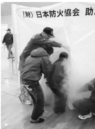
→火災時の煙体験装置