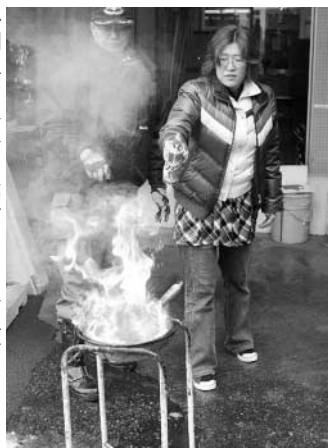
→調理中火災を想定した消火訓練