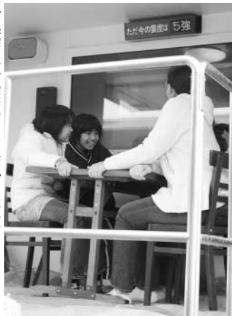
→起震車で震度6の揺れを体験