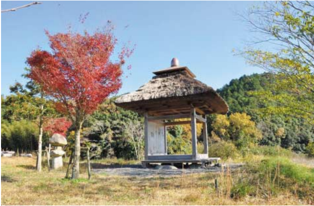
①晩秋のお茶堂 (奈良川河川敷)