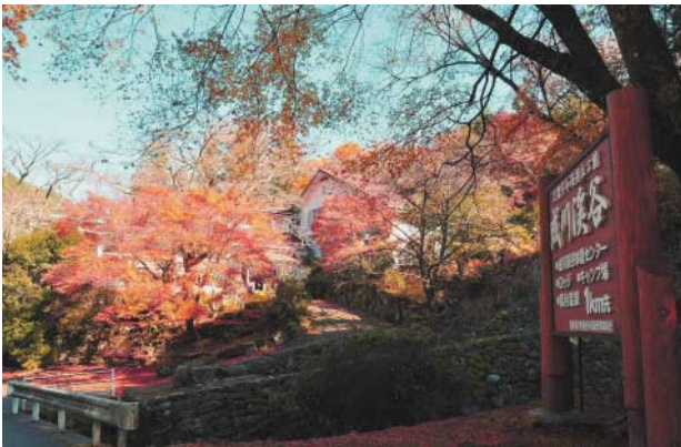
②晩秋の成川溪谷 (成川)