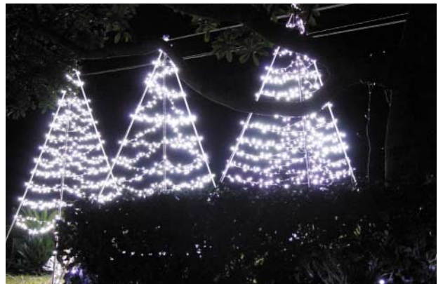
⑥冬の夜を彩るイルミネーション (地蔵味噌)