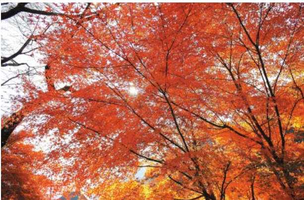
③晩秋のもみじ (日吉小学校)