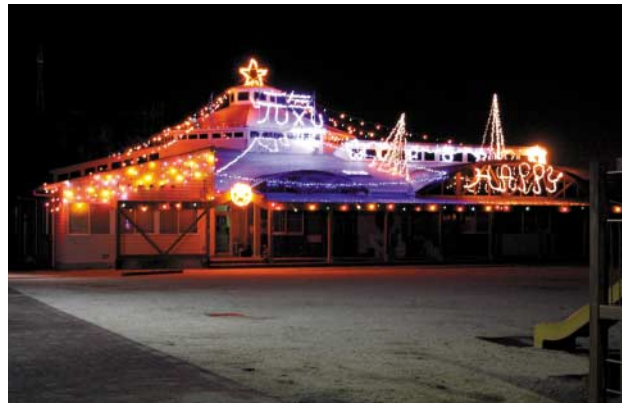
⑤冬の夜を彩るイルミネーション (さくら保育所)