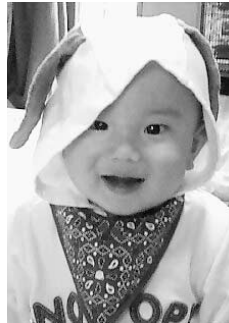
大籠 (1歳・国遠) 怜くん

食欲旺盛なみつちゃん。これからも、 美味しい野菜を沢山食べて、こっちゃん と共にすくすく成長してください。