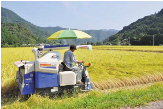
そして、稲刈り・・・