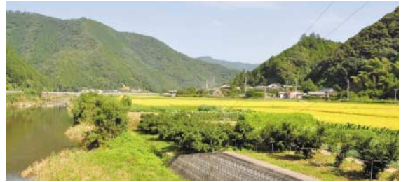
広見川河畔で稲実る