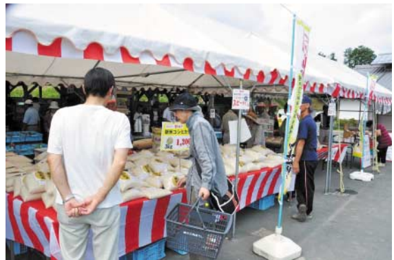
新米展示販売 (三角ぼうし新米祭)