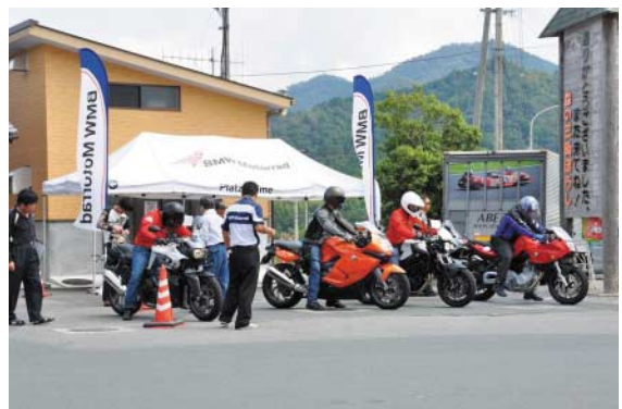
新米祭…試乗ドライバー「いいえベテランです」

稲刈りも終わり、田んぼには稲木が立ち、朝晩めっきり涼しくなり、秋の訪れを感じるようになりました。