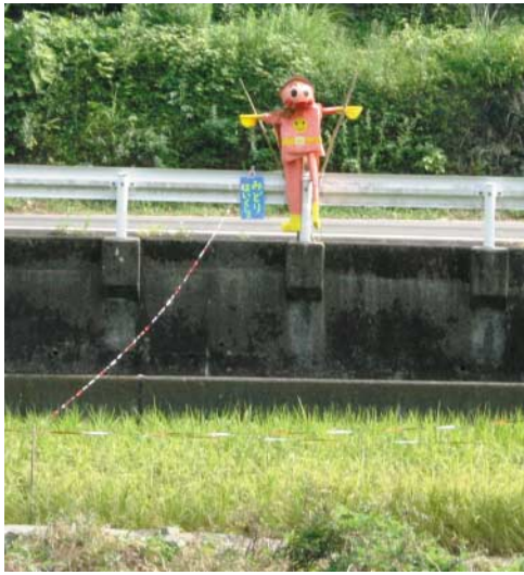
稲穂を見守るアンパンマン