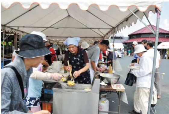
飛ぶように売れて (三角ぼうし新米祭)