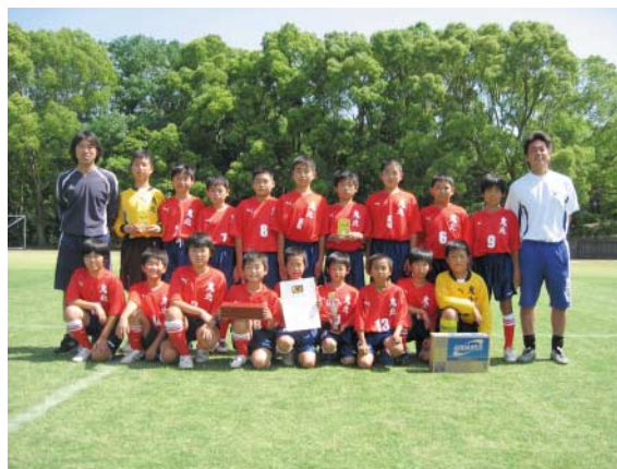
▲鬼北TIGRINHOの皆さん。チームの成績・内容等が評価され、努力賞を受賞しました。

全国少年サッカー大会愛媛県大会が6月6日と14日、新居浜グリーンフィールド、愛媛県総合運動公園球技場で開催されました。