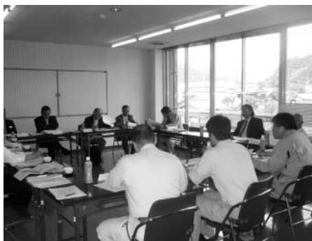
▼第2回委員会の会議の様子