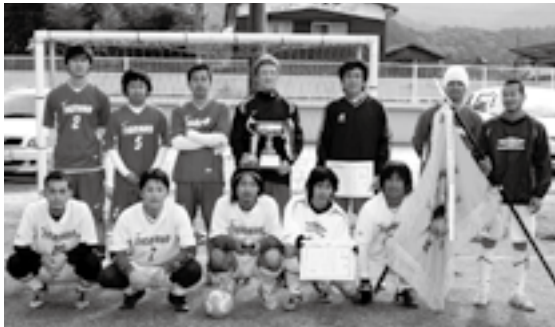
▶優勝したチグリーニョの皆さん

鬼北町で初めてとなるフットサルの大会が11月23日、近永小学校第2グラウンドで開催されました。