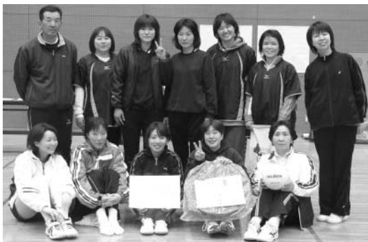
▶近永クラブの皆さん

満開の桜に囲まれた特設会場では、地元の西部芸能クラブと中国人女性の皆さんによる踊り、三味線、大正琴、カラオケなど多彩な演目が披露され、観客を楽しませていました。