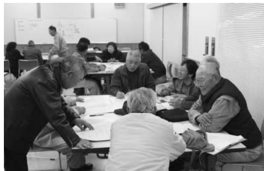
▶熱心に書類を作る会員