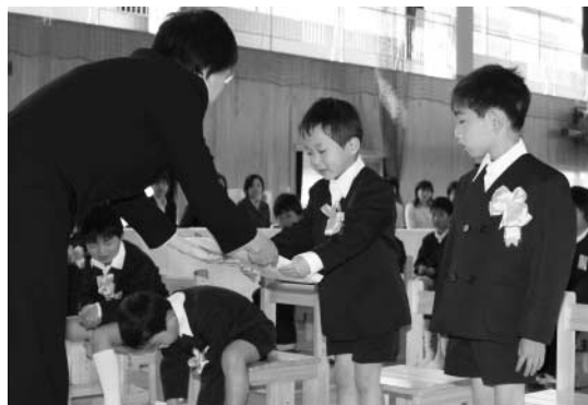
▶新しい教科書を受け取る児童

参加した児童は、青年団員の指導のもと、だんご汁づくりやスポーツなどを行い、新しい友達と交流を深めていました。