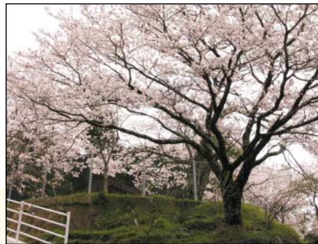
武左衛門広場 (下鍵山)