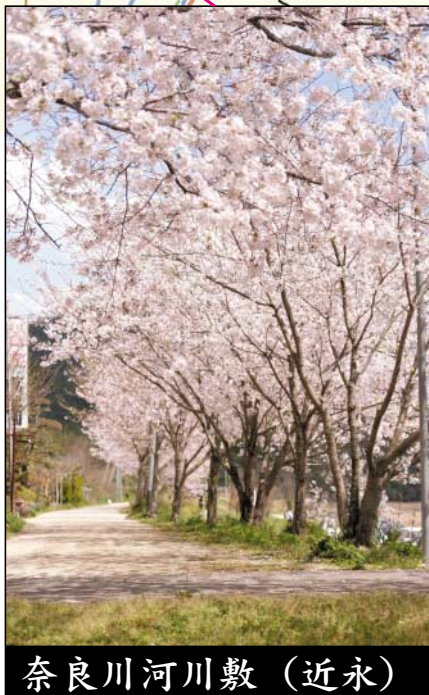
奈良川河川敷 (近永)