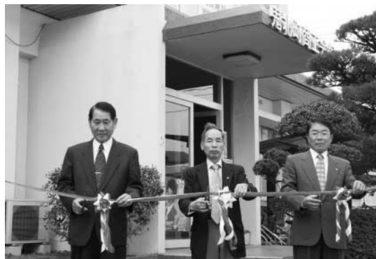
◀関係者によるテープカット