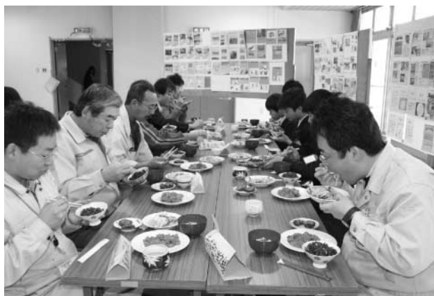
▲おいしい料理ができました！