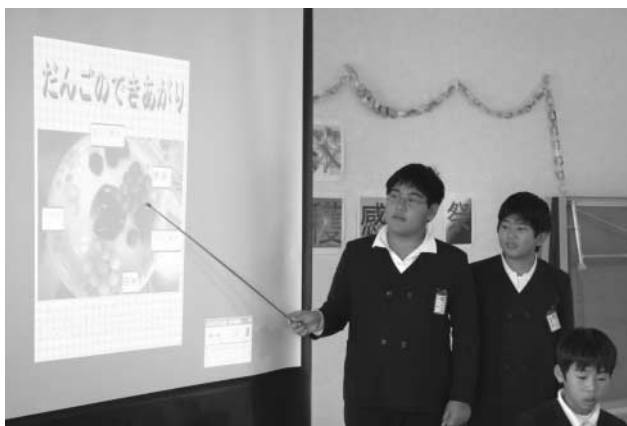
▲古代米作りの成果を発表

2月8日、泉小学校児童が古代米の栽培・収穫に協力された老人クラブや農業改良普及センターの皆さんを招待し、古代米収穫感謝祭を行いました。はじめに、児童が古代米作りの体験を通じて感じたことや学んだことを発表。その後の会食では、古代米を使用した「炊き込みご飯」や「五平餅」など料理5品がテーブルに並べられ、児童が作った料理に出席者は舌鼓を打っていました。