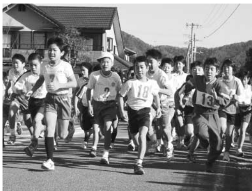
マラソンの部スタート!