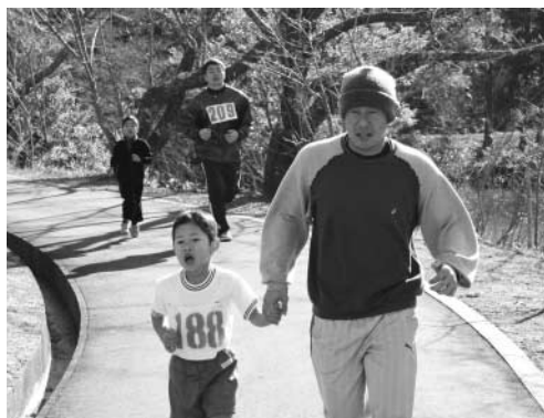
仲良くゴールを目指しました!