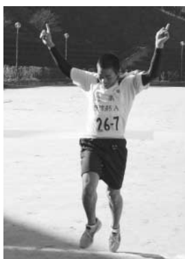
総合優勝は北宇和高校野球部A