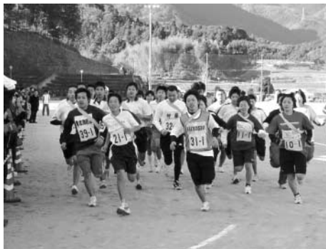
40チームが一斉にスタート

今大会では、大会新記録と大会タイ記録が8つ誕生しました。結果は次のとおり。(敬称略)