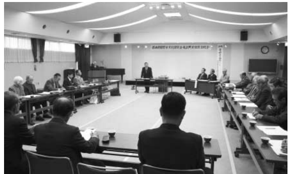
▲予算、事業計画などが承認されました

今回発足した支部では、鬼北町の歴史文化継承の更なる発展を目指し、地域に根ざした活動を展開されます。