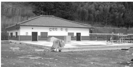
幸田地区農業集落排水処理場