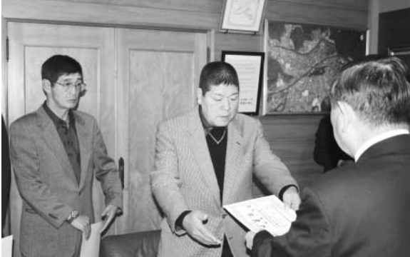
▲委嘱状を受け取る相談員の皆さん