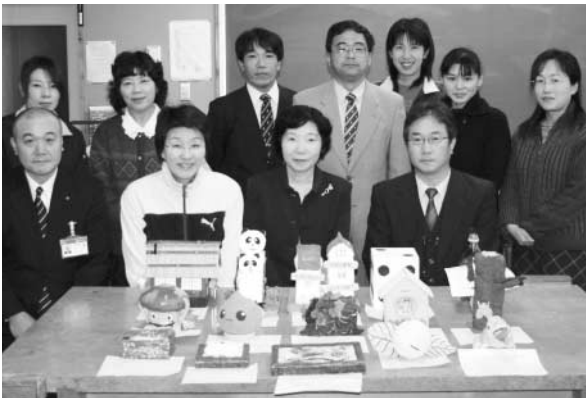
▲表彰を受けた愛治小学校教諭の皆さん (手前は今年度応募作品)