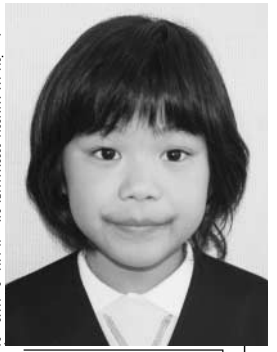
ゆめはようやくだん たか田すずな

わたしは大きくなったらよ うやくやさんになりたいです。 まいにちおしゃべりをしてしごと ができるからです。 おみせにすてきなようやくや バッグ、くつもよういして、お ぎゃくさんによるこんではしい です。わたしもおしゃべりし れをして、たのしくしごとが きたらいいなとおもいます。