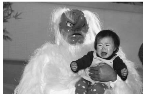
▲天狗の迫力に泣く子ども

1月7日に広見体育センターで子泣かし天狗祭が行われ、平成17年に誕生した幼児41人とその父母が参加しました。幻想的な会場に太鼓の音が鳴り響くなか、鬼ヶ城に棲むといわれる天狗が登場。子どもを抱いた天狗の「元気に育て」との叫び声を合図に、父母が太鼓を打ち鳴らし、子どもの健やかな成長を祈願しました。