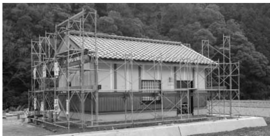
川口地区農業集落排水処理場