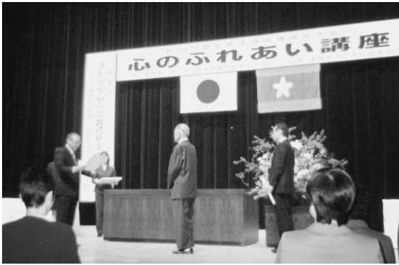
▲表彰を受ける会員