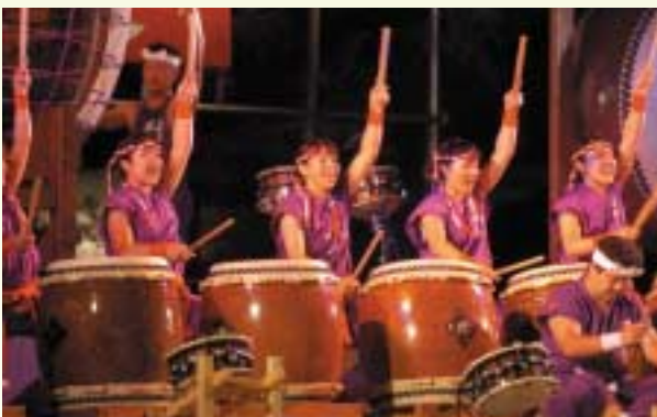
太鼓道場「風の会」(山形県)