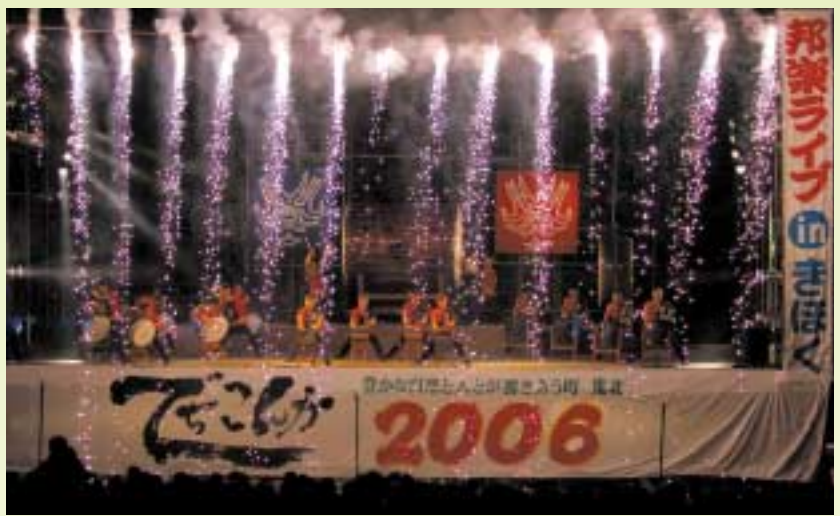
勇壮な太鼓の音と美しい歌声が会場に響きわたる