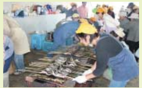
大好評の鮎の塩焼き!