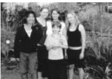
↑素敵な家族との出会い

長いようで短かった十日間。この期間の中で僕は、たくさんのことを学ぶことができました。日本では見ることのできない素晴らしい自然、日本では考えられない学校生活、国は違っても、家族の愛情や絆は決して変わらないことなどの国際的視野を広めるとともに、貴重な体験をすることができました。本当に研修は、最高の思い出になりました。