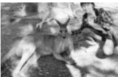
↑カンガルーに触ったよ！

私の海外研修の目的は、外国人の方と交流をし、関係を深めることでした。オーストラリアの方々はとても優しく親切で、目的以上の関係を築くことができ、嬉しかったです。英語を聞きとすることは難しかったけど、伝えよう、聞くという姿勢が大切だと学びました。一つ一つの行動が新鮮で、本当に充実した十日間でした。最高の夏休みになりました。海外研修での経験をこれからの生活に活かしたいと思います。ありがとうございました。