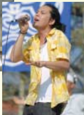
ステージ最後を飾った、「0 SOUL 7」の迫力あるライブパフォーマンス