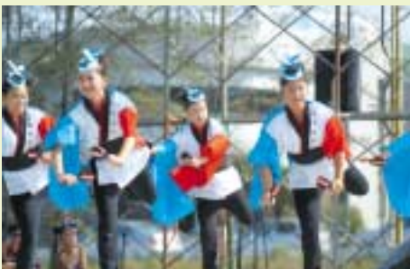
特設ステージで披露された数々の華麗なダンス