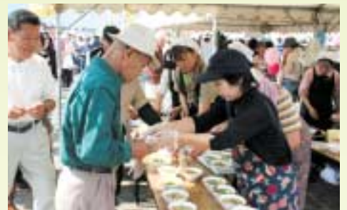
きじ鍋には100m以上の行列