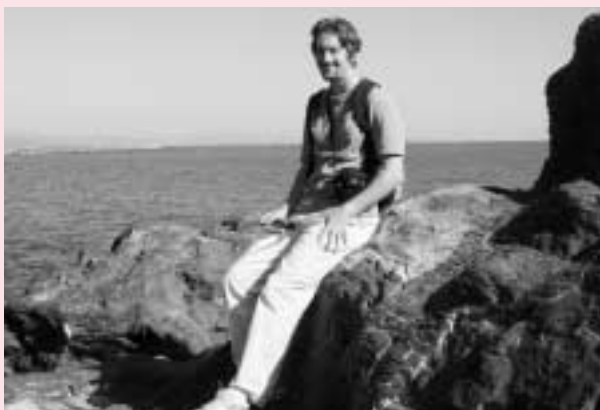
高知県桂浜での一コマ。

四国は景色がすごくきれいなので、車での運転はとても楽しいです。これからも色々なところへ行きたいと思っています。