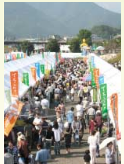
来場者で賑わう会場