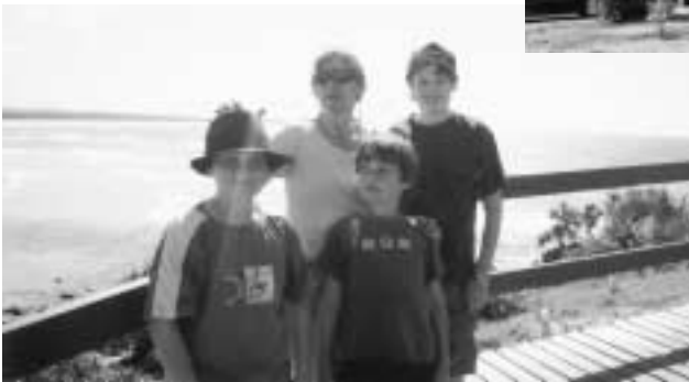
←お世話になったホームステイ先の家族