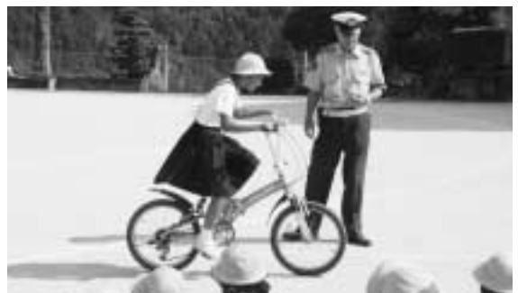
▲安全運転を実践する児童ら

愛治駐在所連絡協議会主催の交通・防犯教室がこのほど愛治小学校で行われ、地域住民と児童が参加しました。愛媛県警音楽隊によるドリル演奏が披露されたほか、交通教室では、警察署員から「自転車に乗るときはカーブや曲がり角でスピードに注意しましょう。」と指導を受けた児童が安全な自転車の乗り方を実践していきました。