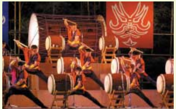
太鼓集団「魁」(鬼北町)