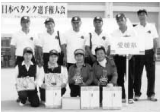
▲出場した選手の皆さん