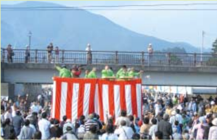
もちまきと同時にびっくり市がスタート