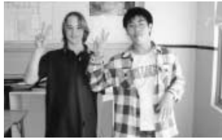
たくさんの友達ができました！

私がこの研修に参加してまず、オーストラリアの人々は、みんなとても親切だなと思いました。言葉については特に不安でしたが、すぐに打ち解けることができました。自分の家族同様に接していただき、たくさんの文化にも触れ、良い思い出となりました。今回この研修に参加できたことに感謝し、これからの生活に活かしていきたいと思います。