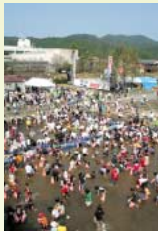
今年も多くの方が、鮎・鱒のつかみどりに挑戦