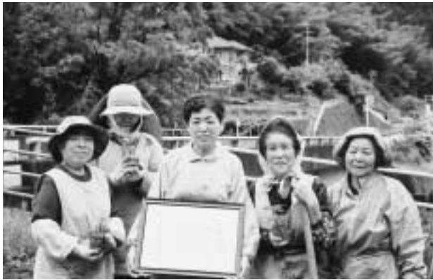
日吉ボランティア協議会会員の皆さん