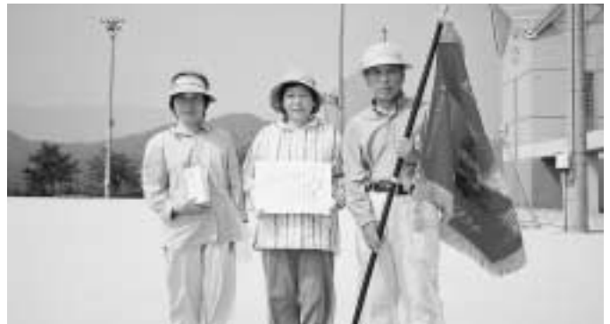
優勝した小松Bチーム