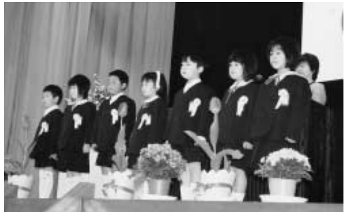
ピカピカの新1年生たち