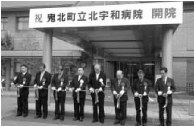
関係者によるテープカット