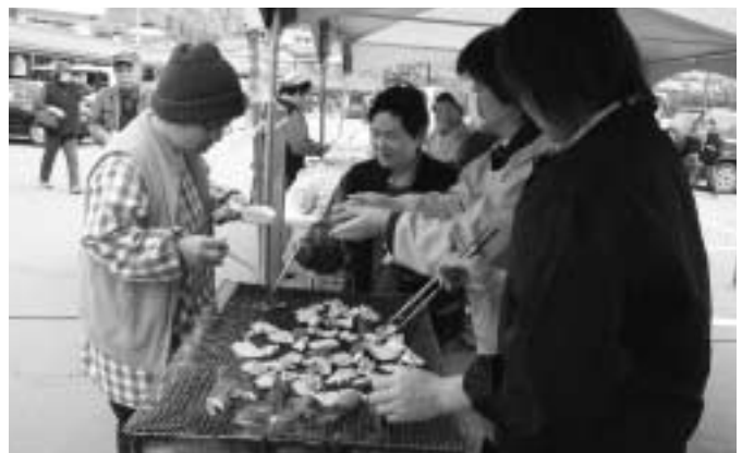
絶品！の鬼北産しいたけ

日吉食の森まつり実行委員会主催の「食の森まつり」が夢産地で開催されました。鬼北町の特産品である「しいたけ」の栽培体験やしいたけ料理が振舞われました。当日訪れた方達は鬼北産しいたけを存分に堪能した様子。次は鬼北産しいたけを使ってオリジナル料理に挑戦してはいかがでしょうか。