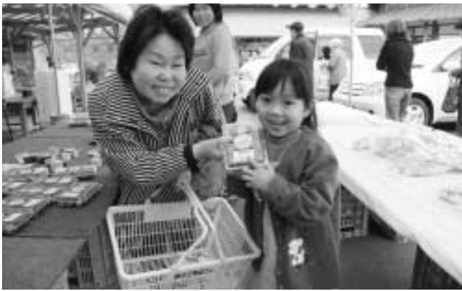
おいしそうなイチゴを手に満面の笑み