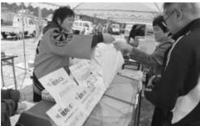
売れ行き好調です！