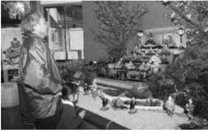
座敷雛に見入る来場者