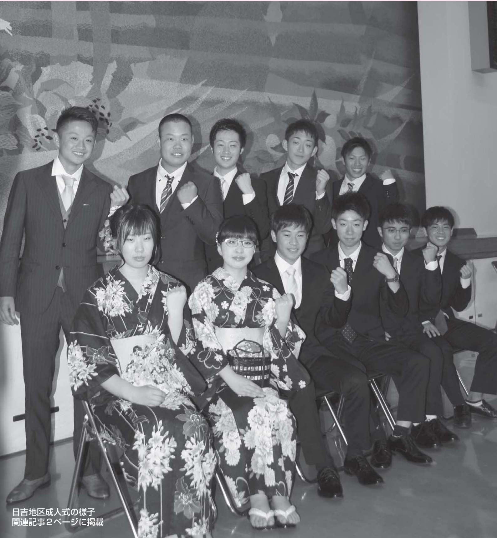
日吉地区成人式の様子 関連記事2ページに掲載