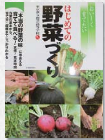
はじめての 野菜づくり 池田書店