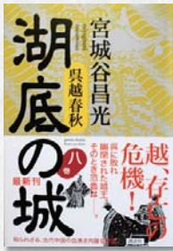
湖底の城 宮城谷昌光