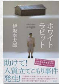
ホワイトラビット 伊坂幸太郎