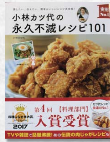
永久レシピ 101 小林カツ代