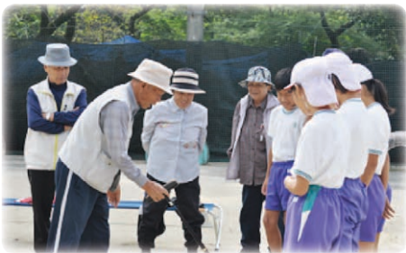
交流会終了後「また今度やろうね」と握手を!