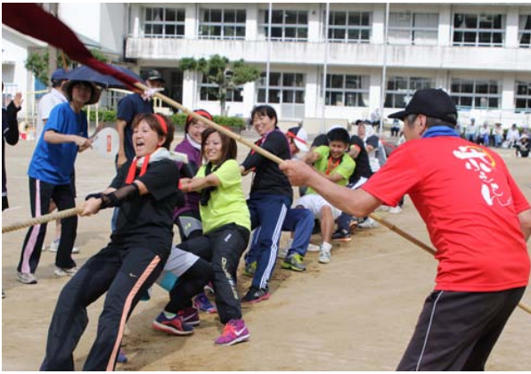
最終種目「綱引き」で優勝した下鍵山分館！

十月二日（日）、農林業者トレーニングセンターで、日吉地区別レクバレー大会を開催しました。