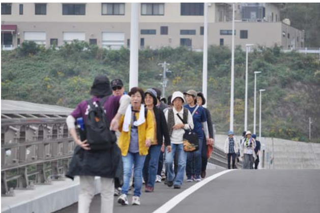
九島大橋を歩く参加者の皆さん