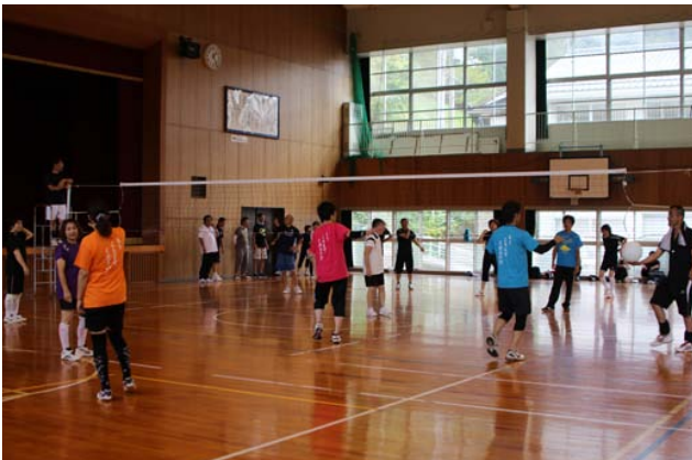
選手の皆さんお疲れ様でした。