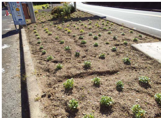
写真は上鍵山の花壇 いつもお手入れありがとうございます。

国道沿いの各花壇にはビオラ千二百本がきれいに植え付けられ、穏やかな気持ちにさせてもらっています。ご協力をいただきました皆さん、本当にありがとうございました。