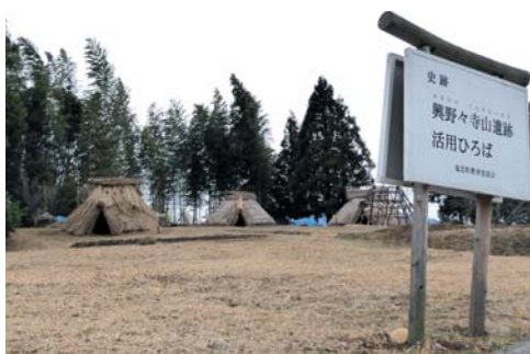
手作りで復元された鬼北の弥生集落

床面で確認されますが、ここではどの住居にも柱穴が認められませんでした。こうした特徴は、近隣の遺跡でも見つかっていない独特な特徴です。「興野々寺山遺跡竪穴住居復元プロジェクト」では、この竪穴住居を復元的に建てて、当時の集落景観を想像できるようにしようと、地元の方々とともに、数年かけて竪穴住居を作ってきました。