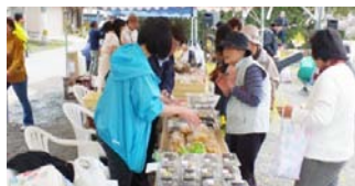
▲珍しい菜の花料理に賑わう

3月26日から11月20日までの間開催される「えひめいやしの南予博 2016」の南予いやし体験プログラムとして、4月2日三島石油店横で「第1回菜の花まつり」が開催されました。来場した方々は生演奏を聴きながら、菜の花や菜種油を使用した料理を堪能したり、菜の花の絵手紙を書いたり、春の訪れを肌で感じました。今後も南予博関連のイベントが開催されますので、ぜひご来場ください。