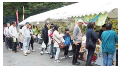
▲きじ鍋を求める大行列

4月3日、成川溪谷休養センター駐車場にて、「成川溪谷桜まつり」が開催されました。満開の桜の花を見ながら、きじ鍋を食べたり、ピザ作り体験をしたり、大人も子どももお花見気分でもっと楽しそうでした。午後は生憎の雨に見舞われましたが、来場者は満足そうに会場をあとにしました。