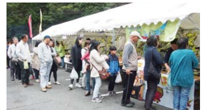
▲きじ鍋を求める大行列

4月3日、成川溪谷休養センター駐車場にて、「成川溪谷桜まつり」が開催されました。満開の桜の花を見ながら、きじ鍋を食べたり、ピザ作り体験をしたり、大人も子どももお花見気分でもっと楽しそうでした。午後は生憎の雨に見舞われましたが、来場者は満足そうに会場をあとにしました。