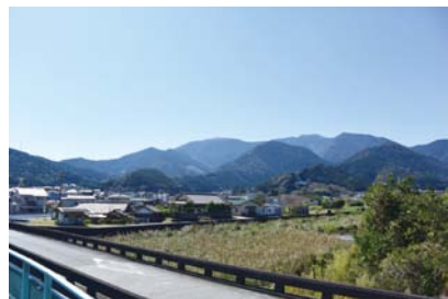
近永方面から見た「奈良山」

山岳信仰とは、山を神聖視し、崇拜の対象とする信仰のことです。自然崇拜の一種です。こうした信仰の起源は古く、民間で広く伝承され、信仰されてきました。山頂にある岩は、山の神様が降臨する場、あるいは宿る場「磐座(いわくら)」とされ、それが信仰の対象となっていました。また領域の境界、例えば国境などの山の境であったりしますが、こういった空間の変わり目にあたる場所も神聖視され、神様が祀られたりします。神様に抱かれた山には霊力が宿