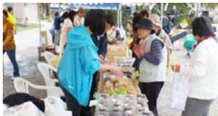
▲珍しい菜の花料理に賑わう

3月26日から11月20日までの間開催される「えひめいやしの南予博 2016」の南予いやし体験プログラムとして、4月2日三島石油店横で「第1回菜の花まつり」が開催されました。来場した方々は生演奏を聴きながら、菜の花や菜種油を使用した料理を堪能したり、菜の花の絵手紙を書いたり、春の訪れを肌で感じました。今後も南予博関連のイベントが開催されますので、ぜひご来場ください。