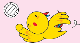
兵庫県マスコット 「はばタン」