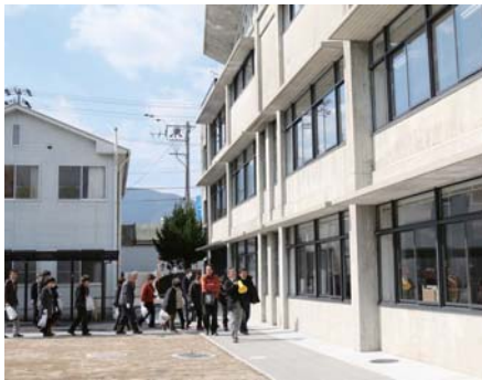
庁舎外観の説明を受ける参加者

2月21日、鬼北町役場本庁舎の改修工事が終了したことに伴い、再生庁舎見学会が行われ、町内外から約