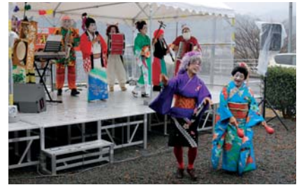
▲雨にも負けず会場を盛り上げる愛治ちんどんクラブ

また、杵つき餅の実演販売は今年も大好評。威勢の良い掛け声をあげながら杵を振り下ろし、年の瀬の雰囲気盛り上げました。