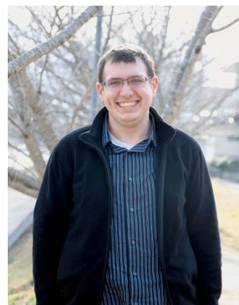
鬼北町外国語指導助手

皆さん、楽しく、そして元気よくこの冬を過ごして、今年も素晴らしい一年にしましょう。