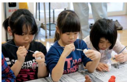
◀はみ出さないように慎重に、慎重に…

今年の干支である猿の土鈴に色を塗っていく児童たち。細かい作業の連続に苦戦しながらも、真剣な表情でオリジナルの土鈴を完成させていました。