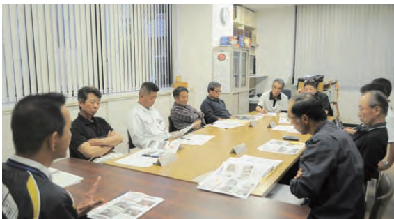
区長・副区長会で情報交換会

その後、みなさんからは、区単位で協力会を設立するのではなく、お互いに助け合ってできないかなど、いろいろな質問や意見がでていました。