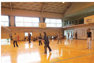
上大野分館は日吉中学校体育館でレクバレーを、優勝は植勝組でした。

上大野分館（六月十四日）と下鍵山分館（六月二十一日）で、運動会が行われました。上大野分館は、あいにくの天候でレクバレーを、下鍵山分館は軽スポーツをそれぞれ行い、健康づくりと地区住民の親睦を深めていました。