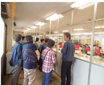
ベルグアースで熱心に説明を聞く部員のみなさん

今年の上鍵山婦人部の活動は、この視察研修を皮切りに、盆踊りや運動会、また、先輩部員のみなさんにお寿司の作り方を習う等計画しています。現在部員は二十二名の少数精鋭ではあいますが、「災害などが起こった時、婦人部がないといけません」と叱咤激励されながら楽しく活動していきます。