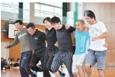
下鍵山分館は組別対抗戦で3種類の軽スポーツを行いました。優勝は11組でした。