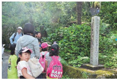
大門峠にある竜馬間脱藩の道の記念碑