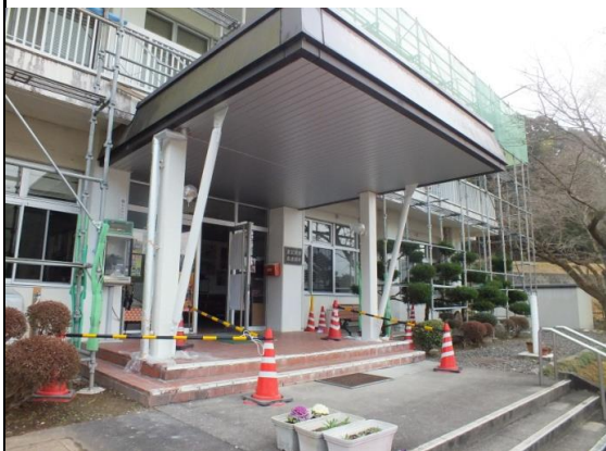
泉公民館補強方杖設置工事の様子

た務設北す民 置葺 泉 。店置町る館 工替 公 が、工奈もの改は事工 民 、そは良の、修は事と館 れぞ鬼山、と耐築三泉 れ北吹屋、震年十公 担町建根葺補十以館 当延、替強上。のた しの補工事と。び、 ま滝強方は目的なる し平方杖は鬼と公 工杖と公 設