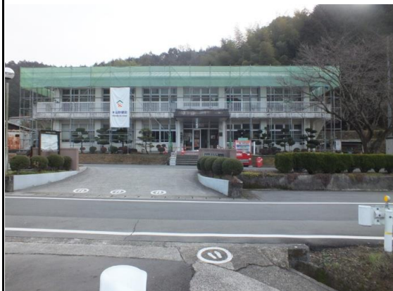
屋根葺替工事の様子

民でりの をり騒いにり 館安、工おおな音たお、年 に全今事かかどやだ住工度 なりなまもげけ、工くま事末 り利で無さし何事皆い期の まし用上にでたごのにやは きたきに終いた。迷出は利周 。る快わ。れ 惑入、用辺