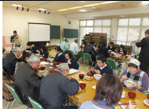
みんなでおいしく

た。た。以 。が、上 あ、様 りが協 が力 とういた ござ ざいた いまし まし 皆さ