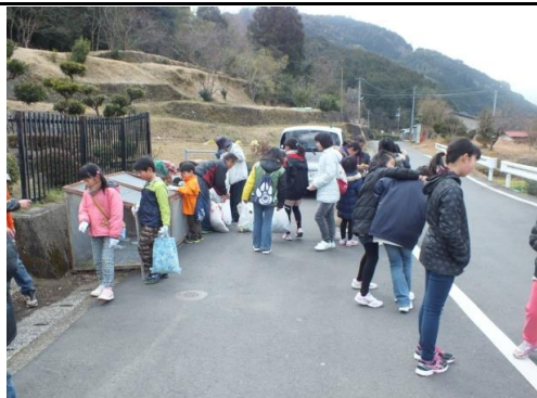
きれいな泉地区を