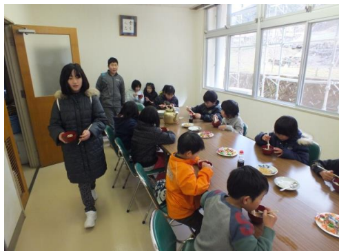
アツアツのぜんざい

た。た。以 。が、上 あ、様 りが協 が力 とういた ござ ざいた いまし まし 皆さ