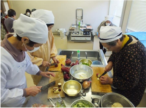
手際良くさばきます

一月三十一日に女性を対象にした「クッキング教室」が行われました。今回は八人が参加して、鶏肉を使った中華料理の「油淋鶏(ユウリンジイ)」など全四品を作りました。参加者は主婦歴●十年ということもあり、慣れた手つきで料理していきました。参加いただきました皆さん、ありがとうございました。