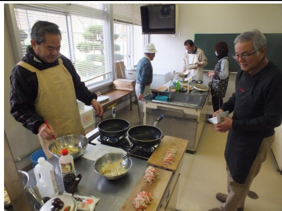
一生懸命つくります

一月三十一日に女性を対象にした「クッキング教室」が行われました。今回は八人が参加して、鶏肉を使った中華料理の「油淋鶏(ユウリンジイ)」など全四品を作りました。参加者は主婦歴●十年ということもあり、慣れた手つきで料理していきました。参加いただきました皆さん、ありがとうございました。