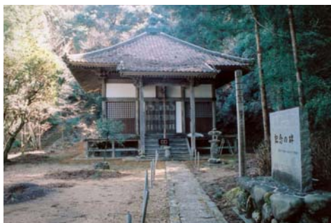
等妙寺の観音堂(町指定有形文化財)

等妙寺の再建について、宇和旧記には、寺院の中心であった伽藍焼失後、寺領・寺宝を取り上げられ、山での居住ができなくなつたので、天正18年(1590)本尊を降ろし、霊光庵のあつた場所、現在の寺地で再建したことが記されています。 さて、発掘調査では焼失した本堂がどのような建物であつたかが分かりました。それは、現在の等妙寺に建っている観音堂とほぼ同じものであつた、日本の寺院建築史での通説を覆す新たな発見でした。次回、そのことについて触れていきたいと思います。