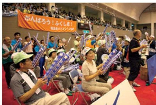
会場での応援の様子(岐阜県池田町)