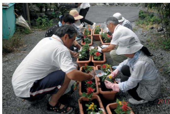
プランターでの花づくりの様子 (岐阜県池田町)