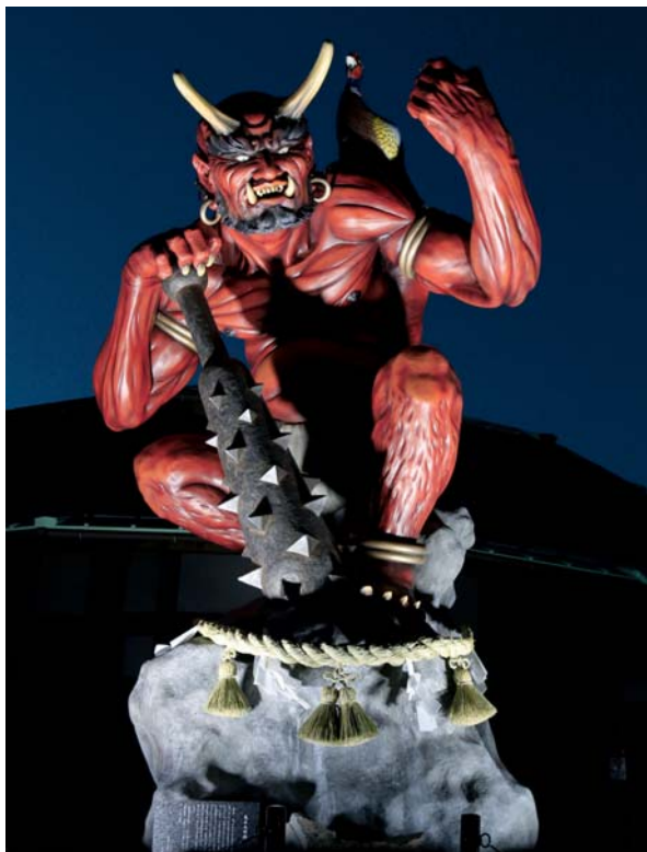
◀ライトアップされた鬼王丸

12月7日、道の駅森の三角ぼうしに設置されている「鬼王丸」のライトアップが行われました。