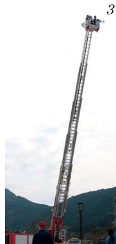
1 軽トラ朝市では至る所で人と人との交流が生まれる 2 ドキドキのはしご車初体験に少し緊張した笑顔を浮かべる子どもたち 3 高く上がったはしご車は迫力満点。会場にいた多くの人が思わず空を見上げた