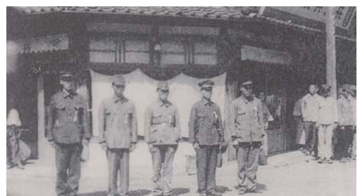
下鍵山の中心部である四つ角で行われた出征兵士の見送り

8月21日・22日の2日間、わたって開催された今年の「ひよし星降るキャンドルナイト」。キャンドルの灯りに包まれた町並み、そして今年初めて行われた明星ヶ丘での段ボールアートでは、さまざまな色彩の光が辺り一面を照らし出しました。また、鬼北町のゆるキャラ「き