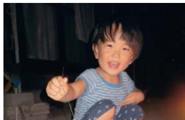
こみなぎ 小美永 ころろくん 3歳 下大野

たける2歳おめでとう♡モリモリ食べる姿がみんな大好き♡これからはパパ目指して大きくなってね!!