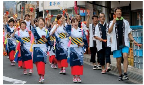
武左衛門や当時の農民に扮した日吉地区の人たちによる「武左衛門一揆行列」(写真左) 昨年より復活した地域住民による練り踊り。 一揆行列がさらに盛り上がりを見せた(写真上)