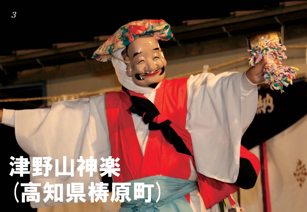
津野山神楽 (高知県梶原町)