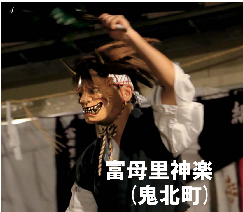
富母里神楽 (鬼北町)