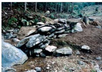
「上の橋」とみられる橋状遺構(南から)

今回は、中世等妙寺の「境内」についてももう少し具体的に考えたいと思います。お寺の領域は必ず「四至」といって土地の境界が定められています。こうした境界には「四至勝示」といって標識となる杭を立てたり、そこに神様を祀ったりします。また、水は不浄を洗い清める力があるとされるため、川を境界とすることが多いことも仏教思想に由来します。こうした境界を定めることを「結界」といいますが、結界にはさまざまな作法（決まりごと）があります。どういった思想に基づいて建てられたのかを知ること、そのお寺が何を教義として大切にしていたかなどを知る手がかりになります。 「等妙寺縁起」には、等妙寺を建てるときに「山ヲ分ケテ四種ノ仏土トナス」といった結果作法に依っていることが記されています。「四種仏土」というのは、仏教の天台教学に基づく「四土結界」を示し、聖域と俗界とを分ける考え方です。簡単にいえば、下から世俗の世界、聖俗入り混じる世界、聖域・菩薩の世界、最上位が仏の世界というものです。また、「縁起」には、俗界から下、中、上の橋を通じて仏地である本堂に至る、と記されます。これらを 現地に照らし合わせると、下の橋は奈良川に架かる「等妙寺橋」で、中の橋は、橋はありませんが、今の等妙寺（かつての靈光庵）のあたりと考えられる。上の橋は、旧境内の中心部に「福寿院跡」というところがあります。その上に橋の基礎を石積みで造った遺構（写真）があります。それより上には、かつての本堂跡や修行のための坊院跡が立ち並んでおり、そこから郭公岳や鬼が城連山などの山岳へと繋がっています。 つまり、仏の境地に至るための場所として、そのものを仏地・聖域と見立てて伽藍中心部を築いたことがわかります。当時として最高の技術で、日本一の規模を誇る石積み伽藍を築くことも仏の境地に近づくための「修行」だったのかもしれない。