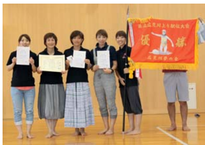
つぶぞロイDEかあんまあくんA