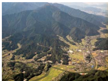
鬼ヶ城連山、通称「奈良山」と山麓（東上空から）

このように広大な敷地を有していたのは、多数の坊院を抱えていたため、その寺院経営のために必要だったのでしょう。さらに宇和郡内に多くの末寺を抱えた等妙寺は、まさに地域の拠点寺院として、その寺格の高さとともに大規模寺院としての威容を誇っていたと考えられます。