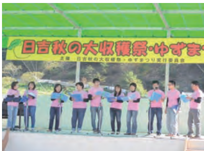
日吉・コールナチュレル(コーラス)