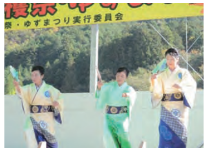
輪の会日吉支部(舞踊)