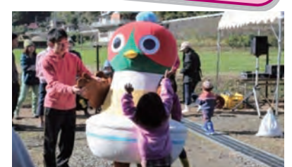
収穫祭でゆるキャラのサポート