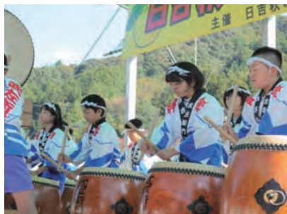
日吉小学生(武左衛門太鼓)