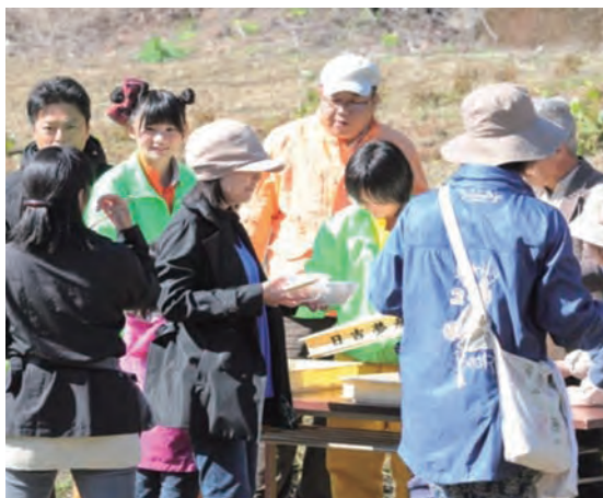
愛の葉ガールズと鍋パーティ

今年、ふれあい農園で農作物の収穫体験や鍋パーティが行われました。この日は、十組の家族が参加。愛の葉ガールズにお手伝いいただき、いっしょに収穫やクイズなど楽しい一日となりました。