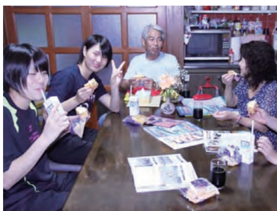
民泊受入家庭での様子