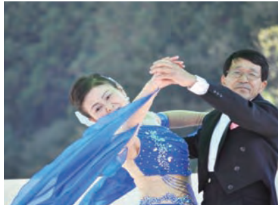
鬼北スポーツダンスサークル(ダンス)

芸能発表会は、屋外ステージで7団体が出演。日頃の練習の成果を発表。太鼓、舞踊、ダンス、コーラスに、沖縄県地方の弦楽器、三線演奏など観客のみなさんを楽しませていました。最後は、出演者たちで「故郷」を合唱しました。