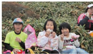
寒かったけどお弁当おいしい！