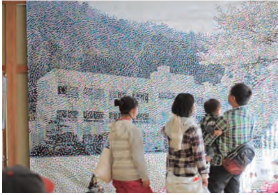
日吉中学校生徒会作品