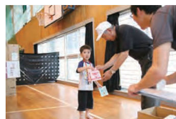
ゴールでは、館長からご褒美が！