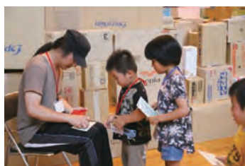
みんな、私についてきて～ やっと見つけたチェックポイント