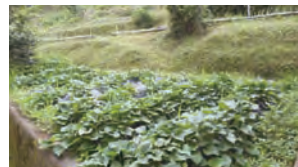
7月8日に撮影。見事に育っています。

六月二日、下鍵山二組の畑でサツマイモの苗の植え付けを、みどり保育所の園児が行いました。保育士さんの指導のもとみんなで一生懸命植えましました。最後に「おいしいサツマイモになれ」と水をやって作業を終えました。 収穫が楽しみですね！その時は声をかけてください。 最後はみんなで記念撮影