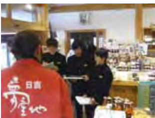
「地域とつながり」 プラン作りのための取材