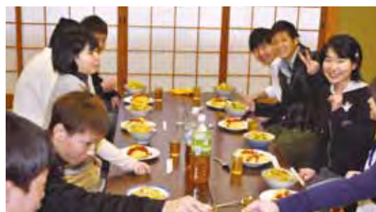
みんなで試食 女の子にはちょっと多かったかな