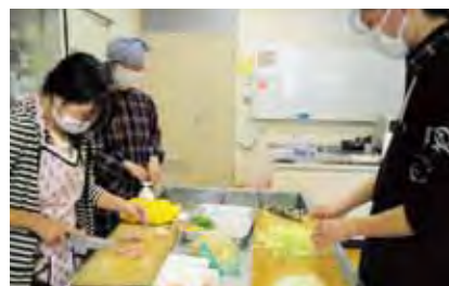
結構うまく包丁を使っています。