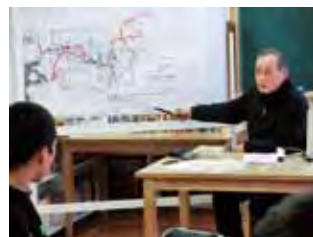
「座学」 武左衛門について学習