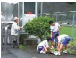
「参画・貢献型活動」 勝山荘にて地域の方と活動