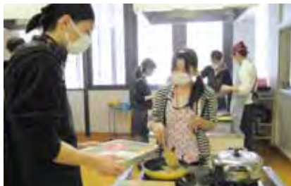
オムライスうまく作れました。