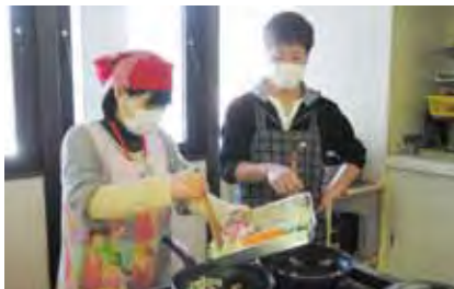
上手にフライパンを使っています。