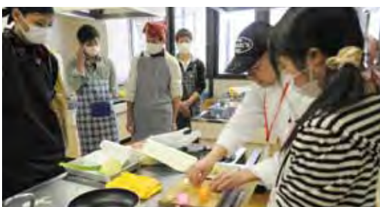
料理教室でアドバイスするシェフ