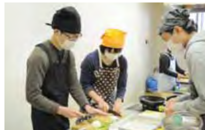
だれが卵をうまくわれるか勝負中