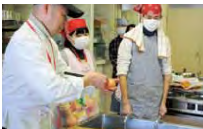
玉ねぎの切り方についてアドバイス