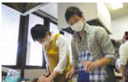
カメラ目線 あぶないよ！