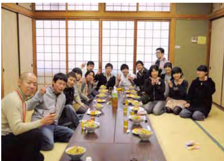
今日学んだことを活かして、一人暮らしがんばってください。