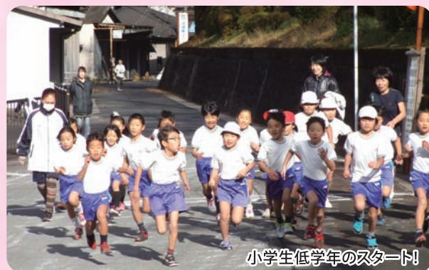
小学生低学年のスタート!

平成二十五年十二月十七日(火)、日吉小中学校で校内マラソン大会が行われました。 はじめに運動場で準備運動をした後、中学校下をスタート。 小学生は低学年が1.6キロ、高学年が2.4キロを、中学生は女子3.6キロ、男子5キロを寒さに負けず、沿道からの声援を力に、みんな最後まで力走しました。