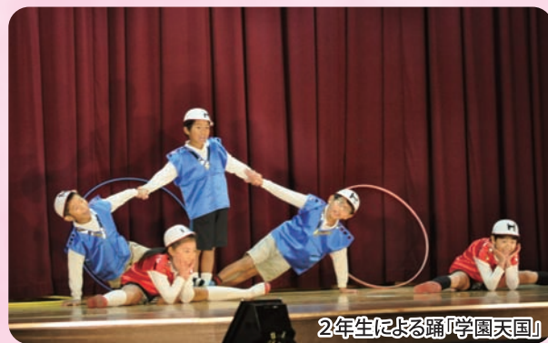
2年生による踊「学園天国」

平成二十五年十一月三十日(土)、日吉小学校学習発表会が農林業者トレーニングセンターで行われました。 児童五十九名が、「さいごまで きみが主役だ 日吉っ子」のテーマのもと音楽・踊り・劇を精いっぱい演じていました。 はじめての一年生はあいさつと「みいつけた」を、最後となる六年生は、武左衛門の衣装で「誇りと信念」の劇を発表しました。地域の皆さんから温かい拍手が送られていました。