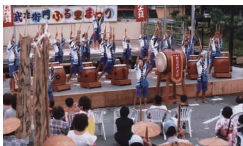
日吉小学校「武左衛門太鼓」 昭和61年から引き継がれています。