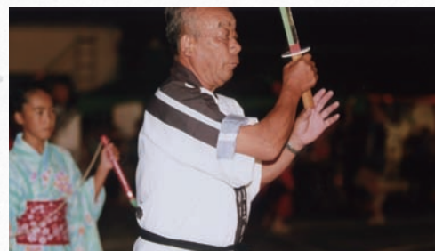
十数年ぶりの「志賀段七」