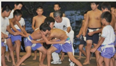
最後の一番、行司の「待った」で来年へ持ち越し

八月二十四日、六地藏奉納相撲大会が武左衛門広場で開催されました。今年の子供相撲のみでしたが、保育所、町内の小学生が出場し、個人戦と団体戦が行われました。 中入の「力飯」や観客からの大きな声援を受け、小学生力士たちは熱戦を繰り広げていました。