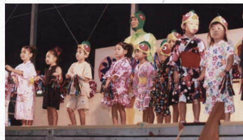
「きのじのうた」でスタート