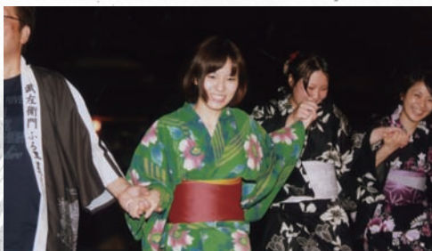
マイム・マイム 皆さん楽しそうに踊っています。