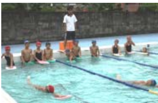
写真は、三島小学校での水泳練習